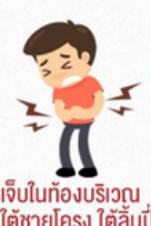
เจ็บในท้องบริเวณ ใต้ชายโครง ใต้ลิ้นปี่