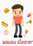
ผอมลง เมื่ออาหาร