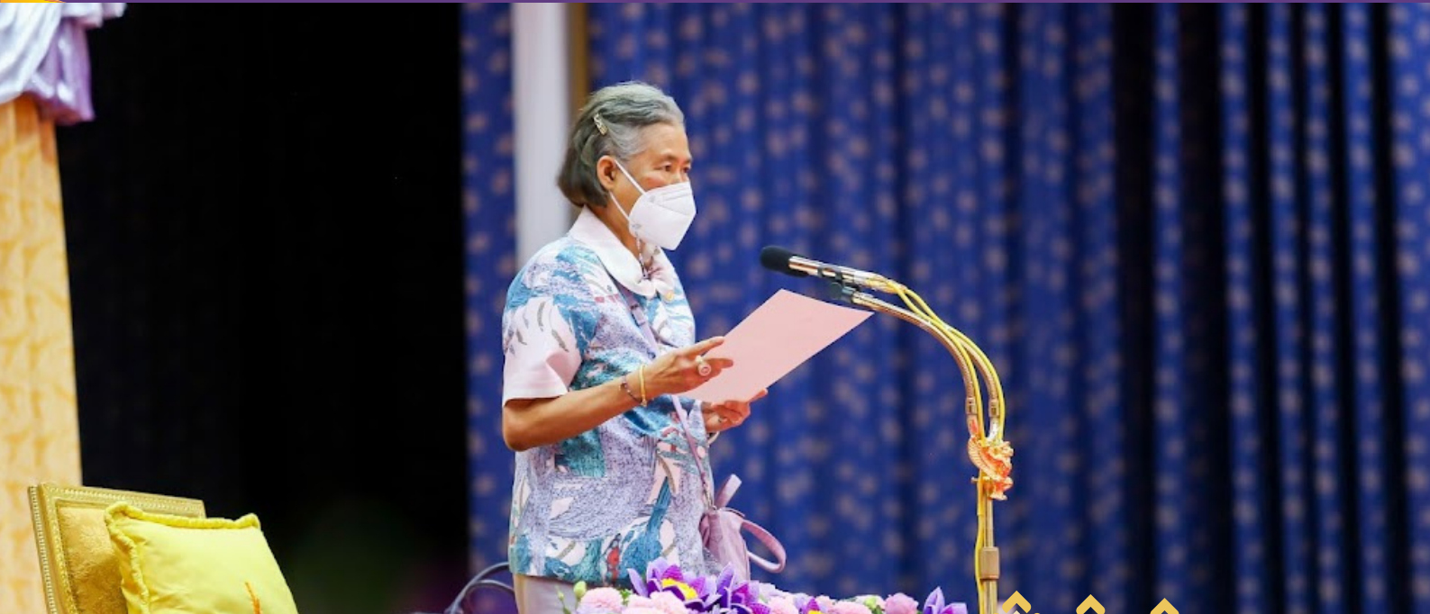
สมเด็จพระกนิษฐาธิราชเจ้า กรมสมเด็จพระเทพรัตนราชสุดาฯ สยามบรมราชกุมารี ทรงเปิดการประชุมวิชาการและนิทรรศการสวนพฤกษศาสตร์โรงเรียนและฐานทรัพยากรท้องถิ่น ระดับภูมิภาค ครั้งที่ 7

ฉบับที่ 8 ปีงบประมาณ 2567 ระหว่างวันที่ 18 - 24 พฤศจิกายน 2566