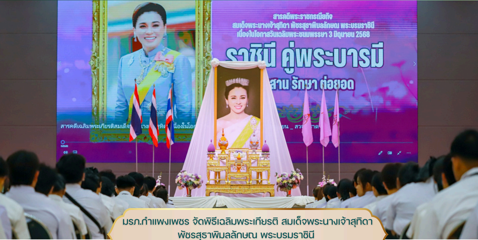
มรภ.กำแพงเพชร จัดพิธีเฉลิมพระเกียรติ สมเด็จพระนางเจ้าสุทิดา พัชรสุธาพิมลลักษณ พระบรมราชินี เนื่องในโอกาสวันเฉลิมพระชนมพรรษา 3 มิถุนายน 2568

ฉบับที่ 136 ปีงบประมาณ 2569 ระหว่างวันที่ 30 พฤษภาคม - 5 มิถุนายน 2569