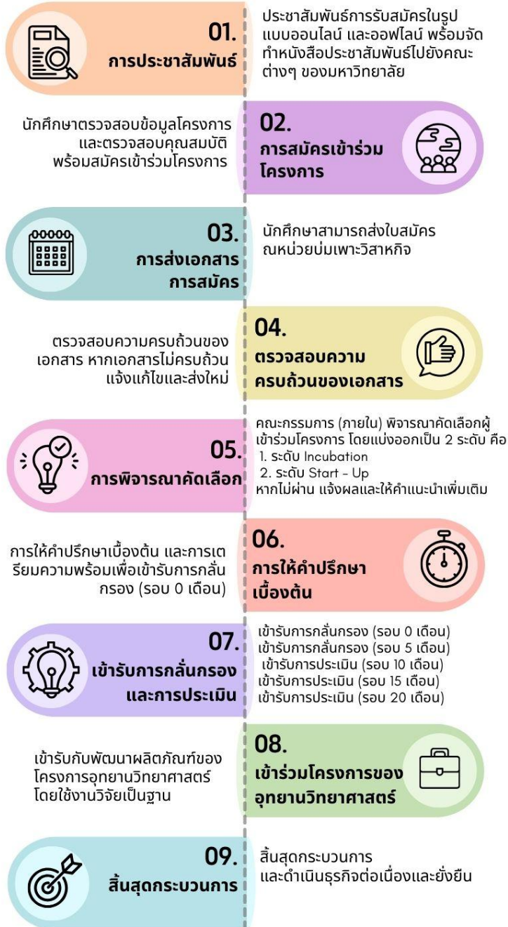
ภาพที่ 1 ขั้นตอนกระบวนการการขอรับบริการการเป็นผู้ประกอบการนักศึกษา มหาวิทยาลัยราชภัฏกำแพงเพชร