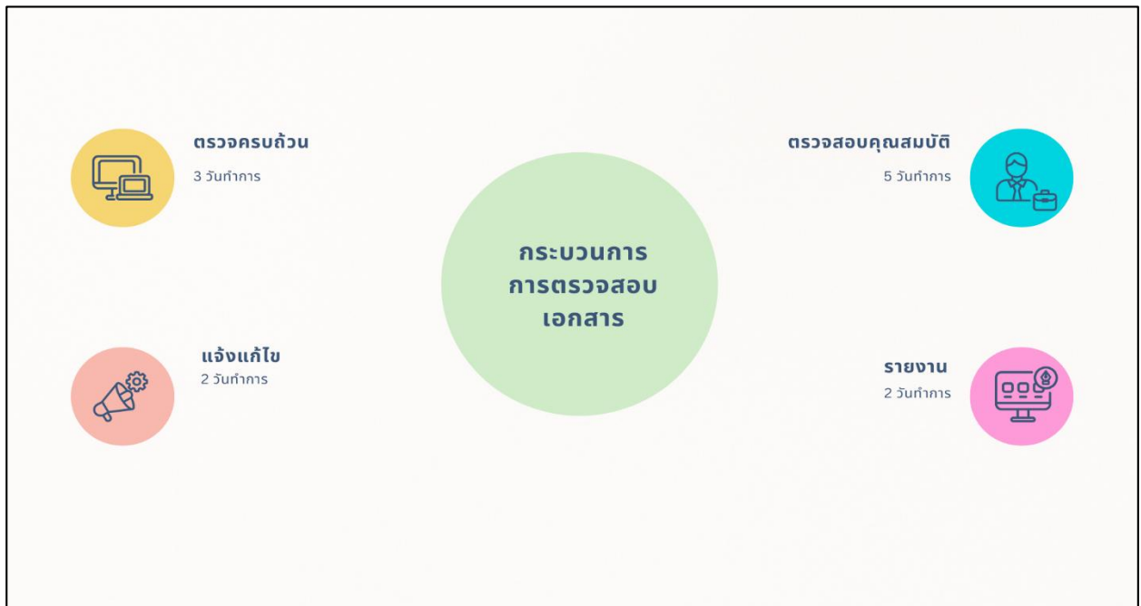
ภาพที่ 2 ตารางกระบวนการตรวจสอบเอกสาร