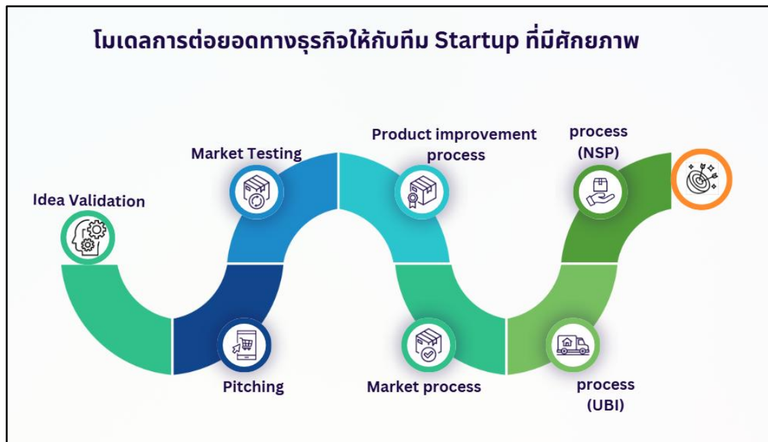
ภาพที่ 5 โมเดลการต่อยอดทางธุรกิจ

11. การบ่มเพาะผู้ประกอบการ มีโมเดลการบ่มเพาะและการต่อยอดธุรกิจ เพื่อให้ธุรกิจ “ไม่สะดุด” เมื่อจบการศึกษา หรือพ้นระยะบ่มเพาะ ดังนี้