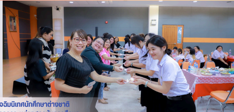
พิธีมอบเกียรติบัตรและปัจจัยนิเทศนักศึกษาต่างชาติ ภายใต้ความร่วมมือทางวิชาการระหว่างสถาบันการศึกษา