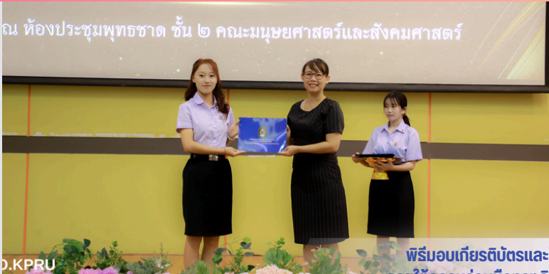
ณ ห้องประชุมพุทธชาต ชั้น ๒ คณะมนุษยศาสตร์และสังคมศาสตร์

ฉบับที่ 125 ปีงบประมาณ 2569 ระหว่างวันที่ 7 - 13 มีนาคม 2569