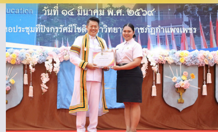
Education วันที่ ๑๔ มีนาคม พ.ศ. ๒๕๖๙ หอประชุมที่บึงกรวศมีโชติ มหาวิทยาลัยราชภัฏกำแพงเพชร