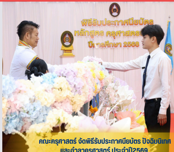
คณะครุศาสตร์ จัดพิธีรับประกาศนียบัตร ปัจจัยนิเทศ และอำนวยการครุศาสตร์ ประจำปี 2569